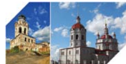
Виртуальная реконструкция Богоявленского собора, г. Енисейск

The report presents the experience of the local and network programs creation with historical and cultural content (virtual museums, virtual tours, multimedia albums, electronic catalogs, etc.). Under consider is experience in using technologies of professional photograph of artistic works of art (painting, drawing, sculpture, DPI), 3d-panorama technology, giga pixel panoramic photography technology (creating high-resolution images), and the content and technological approaches to create interactive three-dimensional historical reconstructions based on 3dMax technology and 3d-engine Quest 3d.